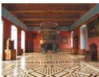
Salle des Gardes (200 places)