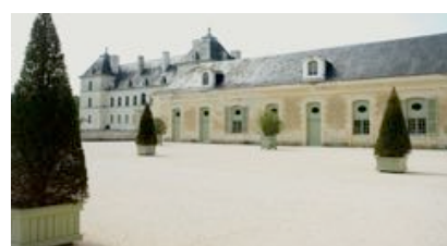
Orangerie (298 places)