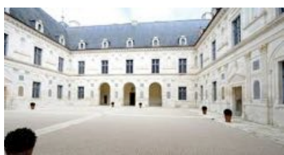
Cour intérieure (600 places)

Après la visite du château ( durée : 1h10mn ), le public assiste au concert qui se déroule toujours dans un cadre incomparable :